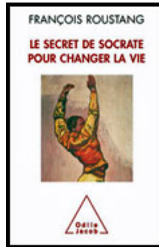
Le secret de Socrate pour changer la vie