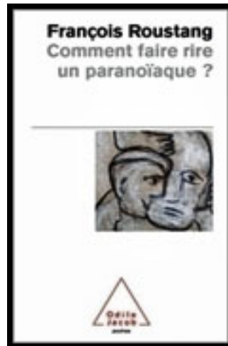
Comment faire rire un paranoïaque ?