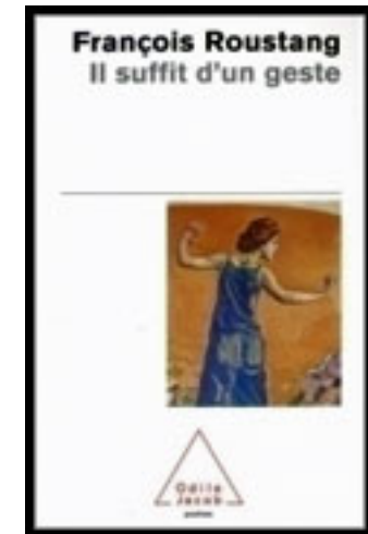
Il suffit d'un geste