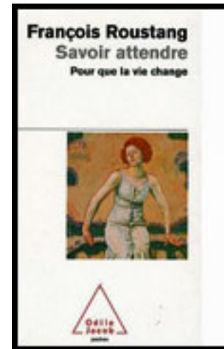
Savoir attendre : Pour que la vie change