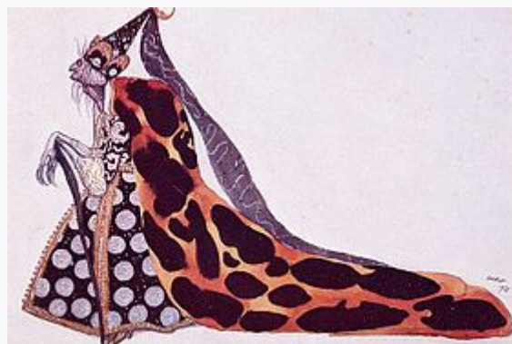
La fée Carabosse , dessin préparatoire réalisé par Léon Bakst en 1921 pour un costume du ballet La belle au bois dormant

Personnage de fiction apparaissant dans Les Contes de ma mère l'Oye .