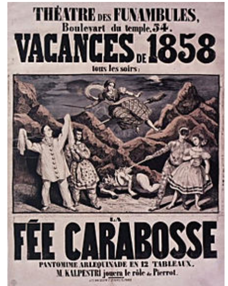
Théâtre des Funambules, affiche du spectacle La fée Carabosse , 1858