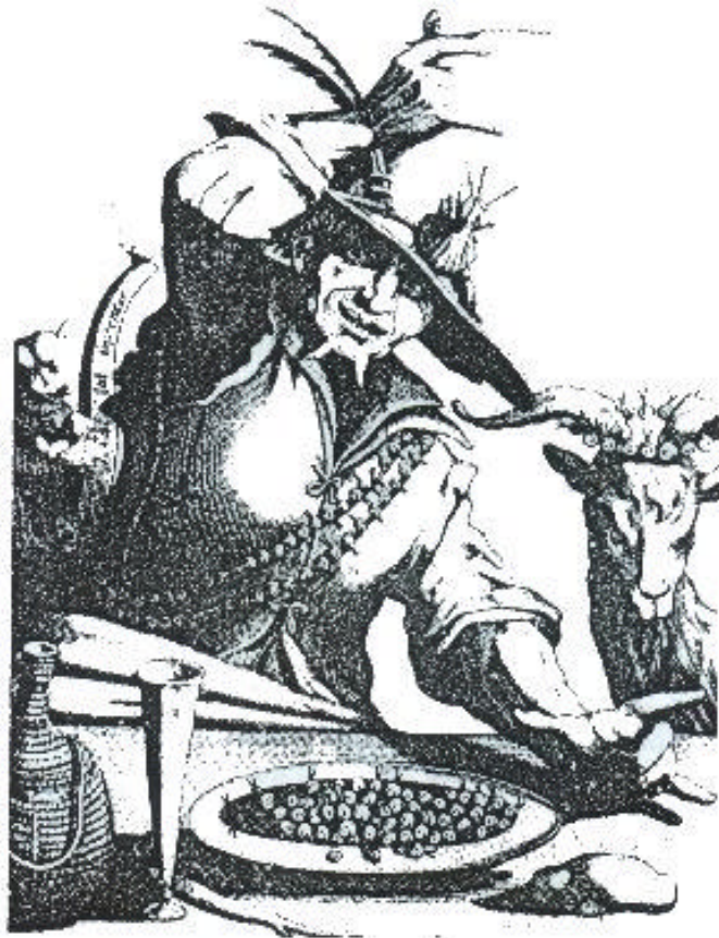
"L'Homme aux Escargots" Gravure au burin de Callot.

Nous vous présentons ici un de ses deux "hommes aux escargots".