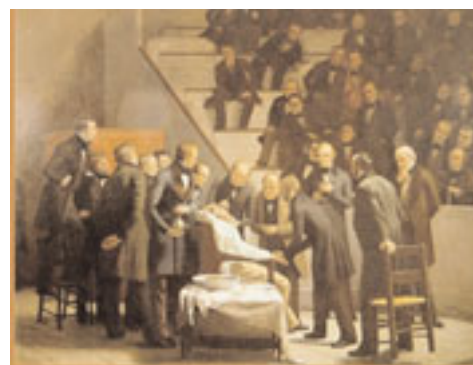
La première utilisation de l'anesthésie par inhalation à l'éther sur un patient avec une tumeur du cou a été réussie par le dentiste William Thomas Green Morton dans l'auditoire de l'Hôpital universitaire de Boston.

Alors que l'anesthésie par infiltration et l'anesthésie tronculaire font partie des plus anciennes méthodes de la médecine dentaire moderne, l'anesthésie d'une dent isolée, dans sa forme actuelle, n'est apparue qu'au début des années quarante et n'est encore que relativement peu pratiquée. Les avantages de cette méthode d'anesthésie sont pourtant l'absence presque totale de douleur à l'endroit d'injection, la faible quantité d'anesthésique utilisée, l'efficacité immédiate, l'extension de la suppression de la douleur limitée strictement au lieu d'intervention, respectivement sa proximité immédiate et l'absence du sentiment d'engourdissement au niveau des lèvres et des joues. L'anesthésie locale représente de nos jours non seulement un pas essentiel dans le cas de nombreuses interventions de médecine dentaire, elle est devenue également l'un des instruments qui ont contribué au mieux à forger une image de confiance en faveur des médecins-dentistes. En effet, c'est à l'aune de la qualité de l'anesthésie locale que les patientes et patients peuvent apprécier la compétence professionnelle de leur médecin-dentiste.