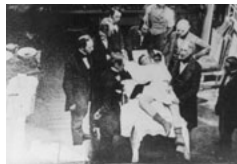
Le fameux chirurgien John Collins Warren a réséqué en 1846, au cours d'une intervention sans douleur, une tumeur du cou chez un patient que William Thomas Green Morton avait préalablement anesthésié à l'éther.

Alors que l'anesthésie par infiltration et l'anesthésie tronculaire font partie des plus anciennes méthodes de la médecine dentaire moderne, l'anesthésie d'une dent isolée, dans sa forme actuelle, n'est apparue qu'au début des années quarante et n'est encore que relativement peu pratiquée. Les avantages de cette méthode d'anesthésie sont pourtant l'absence presque totale de douleur à l'endroit d'injection, la faible quantité d'anesthésique utilisée, l'efficacité immédiate, l'extension de la suppression de la douleur limitée strictement au lieu d'intervention, respectivement sa proximité immédiate et l'absence du sentiment d'engourdissement au niveau des lèvres et des joues. L'anesthésie locale représente de nos jours non seulement un pas essentiel dans le cas de nombreuses interventions de médecine dentaire, elle est devenue également l'un des instruments qui ont contribué au mieux à forger une image de confiance en faveur des médecins-dentistes. En effet, c'est à l'aune de la qualité de l'anesthésie locale que les patientes et patients peuvent apprécier la compétence professionnelle de leur médecin-dentiste.