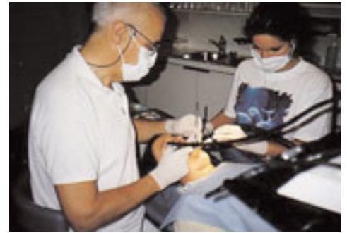
A la suite du stade premier de l'hypnose, passage au renforcement sous direction ciblée, verbale et suggestive.

Afin de protéger les patientes et les patients des abus, deux sociétés d'hypnose reconnues se sont constituées en Suisse (encadré). Les membres de ces sociétés – des médecins, des psychologues et des médecins-dentistes diplômés – sont, au plan professionnel, liés