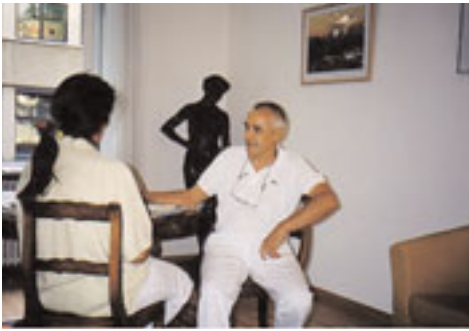
Au cours d'un entretien personnel avec le patient, la prise de contact, le médecin-dentiste présente les possibilités thérapeutiques par l'hypnose.

le succès du traitement étant conditionné en grande partie par la collaboration active de la patiente ou du patient. En état d'hypnose, la personne ne se sent pas dans un niveau de conscience rationnel, analytique, dépendant de sa volonté, mais plus sensoriel, fantaisiste et intuitif – présentant des caractéristiques physiologiques et psychologiques typiques: modification de la fréquence cardiaque, du pouls, sentiment de calme et de détente, attention focalisée, etc. En pratique dentaire, l'hypnose aide par conséquent les patients anxieux à se sentir à l'aise et à accepter le traitement comme une chose agréable ou pour le moins banale. A côté de ces indications strictement médico-dentaires de réduction de l'anxiété et de la douleur, l'hypnose peut contribuer à contrôler le réflexe de vomissement, à tolérer l'adaptation à une prothèse dentaire ou à la détente de la musculature de la mastication. L'hypnose et les instructions concernant l'autohypnose se sont révélées une voie royale dans le traitement de différents troubles fonctionnels de l'articulation de la mâ-