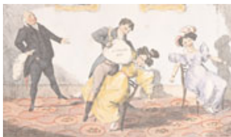
Avant que le dentiste Horace Wells, le premier, se serve du gaz hilarant lors d'extractions dentaires, le produit avait fait une carrière de drogue récréative dans les milieux aisés.