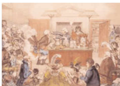
Le chimiste Humphry Davy (au centre) a découvert le gaz hilarant en 1799.