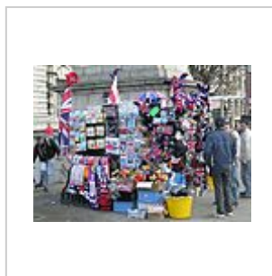
Étal d'un marchand de souvenirs à Londres