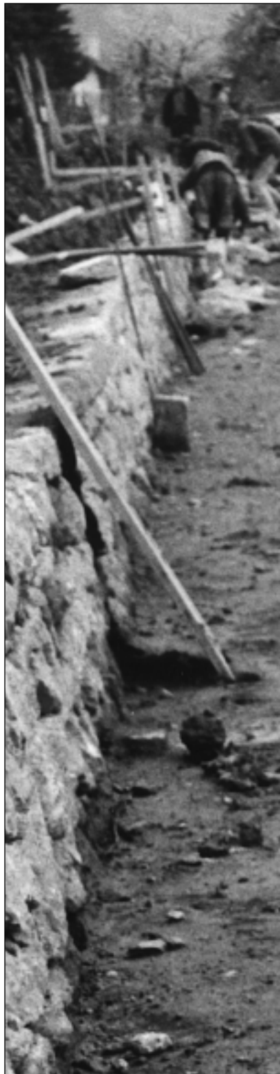
«Fotografie Trockenmauern», Stiftung Umwelt-Einsatz Schweiz

Pour éviter ce piège dans lequel beaucoup d'aidants tombent et dans lequel tombent aussi beaucoup de praticiens des médecines populaires, il est absolument nécessaire que celui qui occupe la place de l'aidant reste relié à sa part blessée, ceci impliquant l'exigence de rester en contact avec ses fragilités, ses