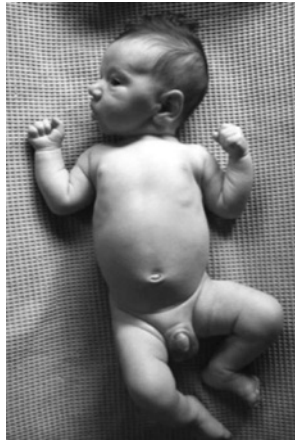
Figure 2. Nouveau-né de 2 mois. Les membres supérieurs et inférieurs, mais également les extrémités (orteils et doigts) présentent une position en flexion.

Le nouveau-né montre une répartition tonique très déséquilibrée caractérisée par une hypotonie axiale et au niveau des membres, une hypertonie des muscles fléchisseurs associée à une hypotonie des extenseurs ( figure 2 ).