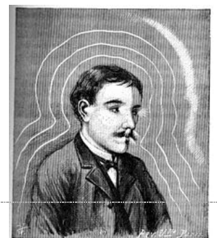
Fig. 2. — Courbes enveloppant un sujet extériorisé. Croquis exécuté par Albert L.

Illustration du livre d'Albert de Rochas d'Aiglun, L'extériorisation de la sensibilité , Paris, 1899.