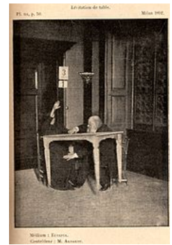
La médium Eusapia lors d'une expérience contrôlée par Alexandre Aksakof en 1892.