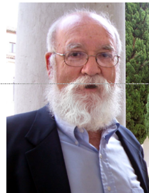
Pour Daniel Dennett (ici en 2006), les philosophes doivent s'assigner la tâche de clarifier et d'unifier les points de vue si souvent conflictuels des différentes branches de la science pour parvenir à les fonder dans une vision unique de l'Univers.

Dans sa version radicale, le naturalisme refuse toute rupture épistémologique ou tout fossé logique infranchissable entre les faits naturels et les valeurs, celles-ci pouvant être expliquées naturellement. Toutefois, l'explication d'un fait n'en constitue pas la justification, et le naturalisme philosophique n'a pas de caractère prescriptif : il ne prétend pas dire ce qui doit être ou ce qui doit se faire. Les doctrines morales ou politiques qui tentent de se justifier à partir de thèses relevant du naturalisme ( darwinisme social , eugénisme , certaines formes de l'écologisme ) en constituent donc, en ce sens, des dérives.