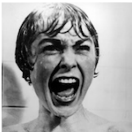
Image de la vignette extraite du film "Psychose" d'Alfred Hitchcock

Avec plus de 6 milliards d'êtres humains, il n'est pas étonnant que la liste des phobies soit assez longue. Parmi celles-ci certaines sont assez étranges comme la peur des fruits, des petits trous, des palindromes ou encore des pénis en érection.