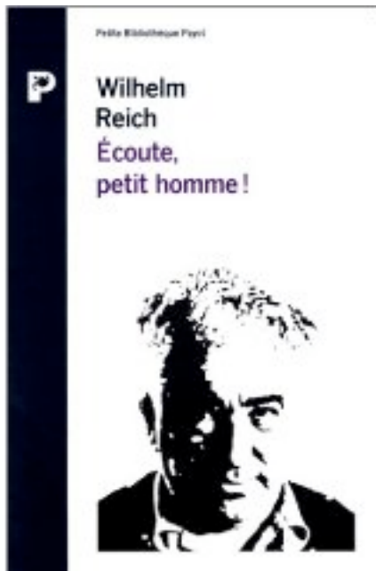
Wilhelm Reich : Écoute petit homme