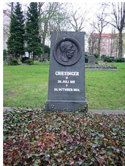
La tombe de Wilhelm Griesinger