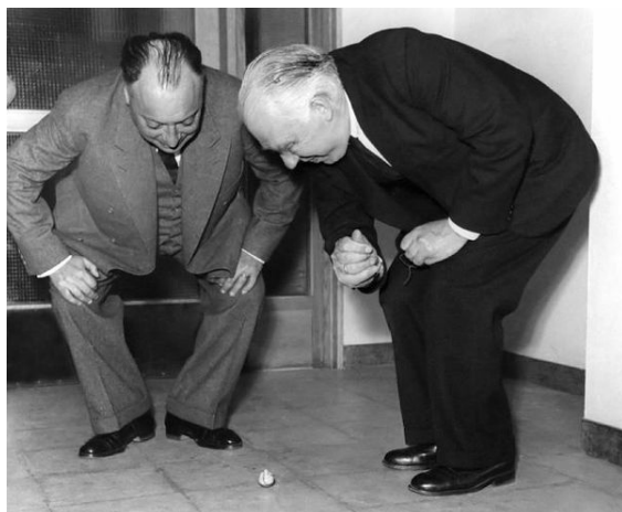
Pauli et son collègue Bohr observant une toupie tippe-top , ou « toupie magique », dont la particularité est de se retourner durant sa rotation (spin). (Lund, Suède, juillet 1954)

fermions, ne peuvent se trouver dans le même état quantique.