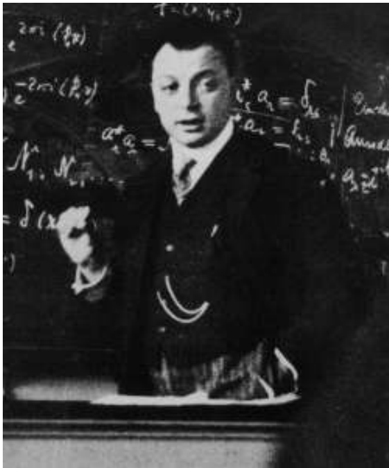
Wolfgang Ernst Pauli