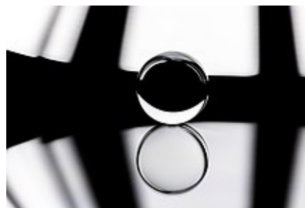
Expérimentation photographique avec une boule de cristal.