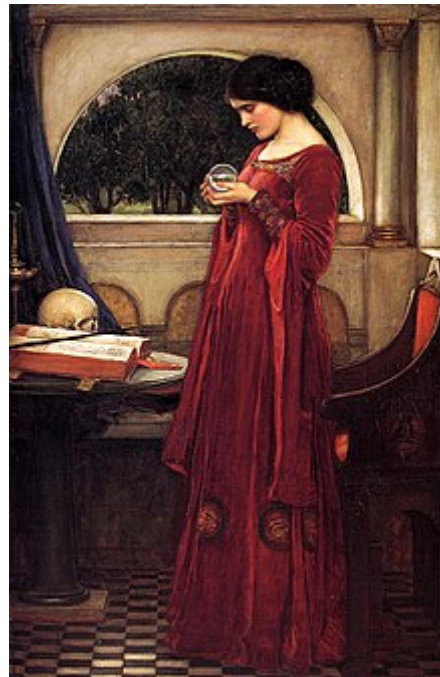
The Crystal Ball , tableau de John William Waterhouse (1902).