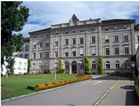
La clinique psychiatrique du Burghölzli.