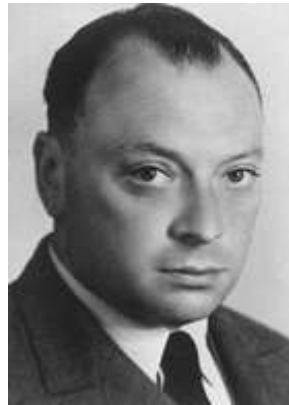
Wolfgang PAULI (1908-1958)

Carl Gustav JUNG s'est intéressé avec le physicien Wolfgang PAULI à ces "phénomènes uniques", non statistiques. A titre d'exemple, JUNG raconte cette anecdote: