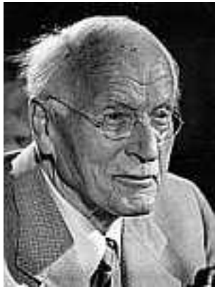
Carl Gustav JUNG (1875-1961)

secondaires de remèdes, parfois rares, mais assez intenses pour inquiéter leur commercialisation.