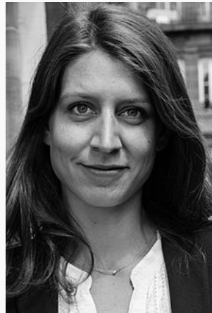
Adèle Van Reeth en 2013 1 .