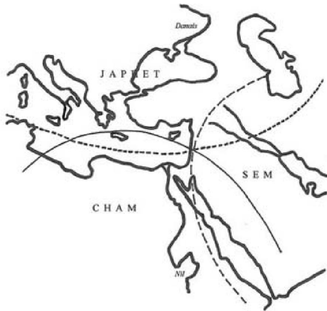
Fig.1. D'après Y.Aharoui et M.Avi-Yonah. « La Bible par les cartes », fig.15. Brépols.1991.

La subdivision du monde, selon l'Ancien Testament, remonte au partage effectué, après le Déluge, entre les trois fils de Noé : Sem, Cham et Japhet (Gn.10, 1Ch.1, 1-24). Cela donne alors trois aires humaines aux délimitations floues et partiellement chevauchantes, mais qui ont un point commun de recoupement, essentiel, sur les monts de Judée (fig.1).