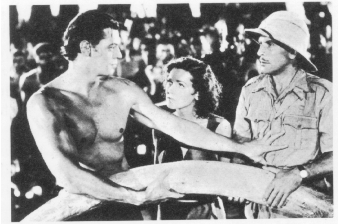
L'homme entièrement corporel. Tarzan joué par J. Weissmueller.