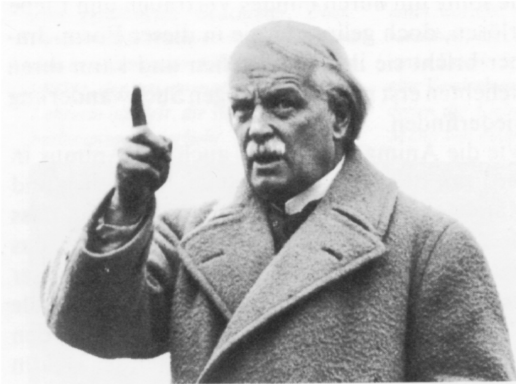
Le dépositaire de la parole: l'orateur Lloyd George.