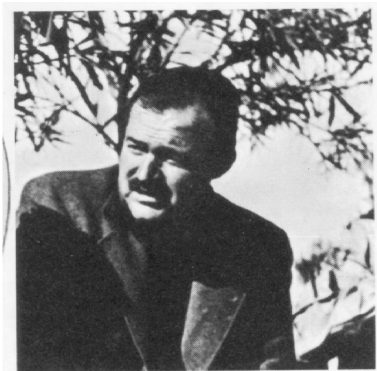
L'homme des actes (der Mann der Tat), le'écrivain, le héros de guerre américain, etc.