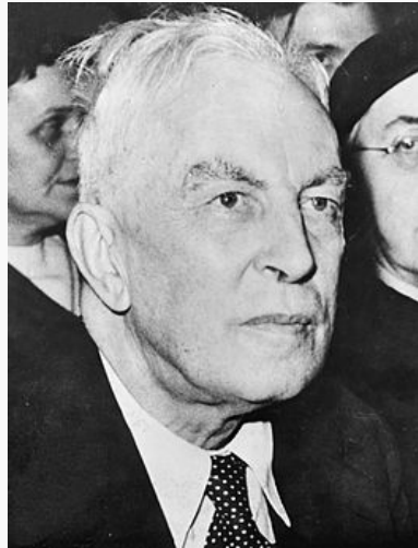
Arnold Toynbee en 1967.