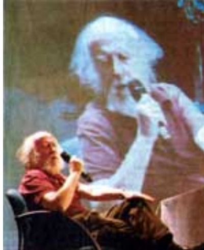
Hubert Reeves lors d'une de ses conférences