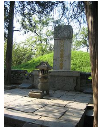
Tombe de Confucius