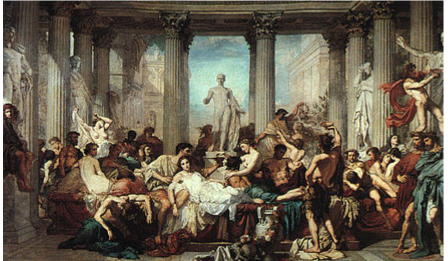
Les Romains de la décadence , peinture académique de Thomas Couture , 1847.