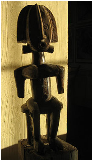
Un fétiche Yoruba du milieu du xx e siècle, censé favoriser la fertilité.

En ethnologie , on désigne du nom de fétichisme l'adoration d'un objet (statuette, etc.) dans le cadre d'une pratique religieuse ou mystique . Le fétichisme consiste dans l'adoration des objets naturels, tels que les éléments, surtout le feu, les fleuves, les animaux, les arbres, les pierres mêmes ; ou d'êtres invisibles, génies bienfaisants ou malfaisants, créés par la superstition et la crainte, tels que les grigris de l' Afrique centrale , les burkhans de la Sibérie , etc.