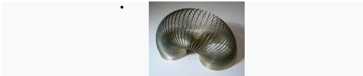
1943. Le Slinky.