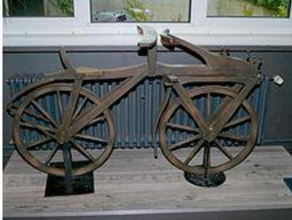
1817. La draisienne, ancêtre du vélo. C'est par hasard que le baron von Drais découvrit que le guidon lui servait à conserver l'équilibre.