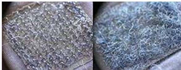
1941. Le Velcro, inventé par Georges de Mestral après l'observation au microscope des crochets naturels de la bardane.