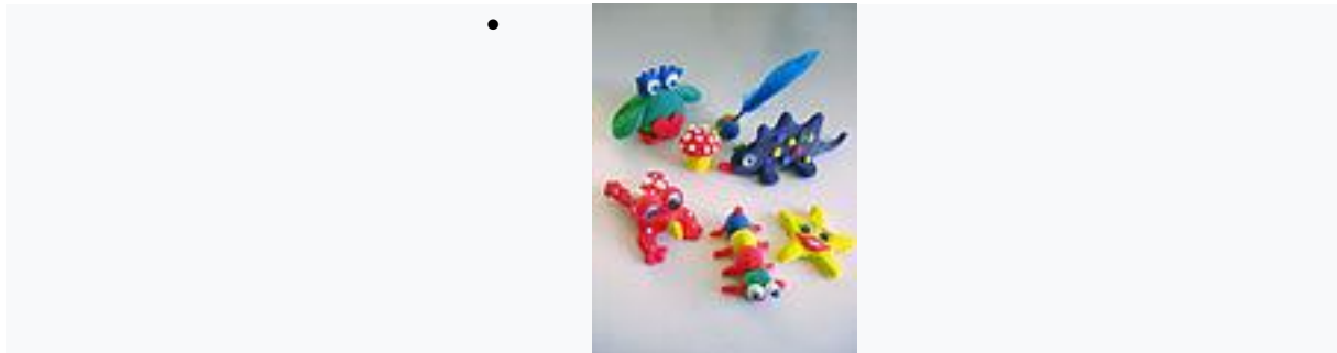
1956. Le Play-Doh.