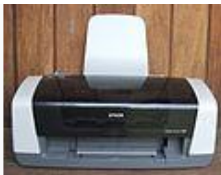
1977. L'imprimante à jet d'encre.