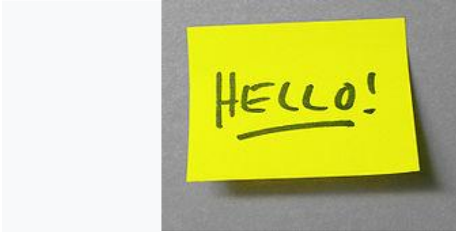
1980. Le Post-it.