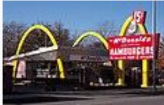
1954. Le premier McDonald's.