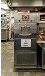
1945. Raytheon RadaRange.