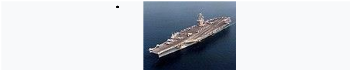
Ceinture de blindage des porte-avions nucléaires américains.