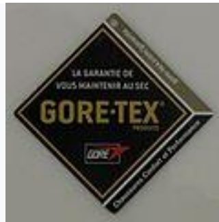
1970. Le Gore-Tex.