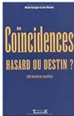
Coïncidences, hasard ou destin ? 590 histoires insolites 2003