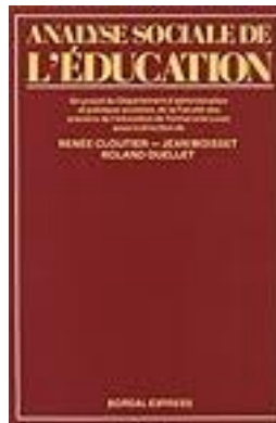
Analyse sociale de l'éducation 1991