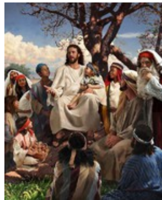
Jésus, entouré de fidèles

Malgré cela, le nombre de chrétiens continua à augmenter. Mais au IV e siècle, l'empereur Constantin leur accorda la liberté de pratiquer leur religion puis se convertit lui-même : le christianisme devient finalement la religion de l'Empire romain. Petit à petit, des églises se construisent. Les chrétiens s'y réunissent pour prier ensemble, dirigés par un prêtre . Le christianisme est encore présent aujourd'hui en France comme dans d'autres pays du monde (il y a une église dans presque chaque commune, dans notre calendrier les années sont comptées depuis la naissance de Jésus-Christ, beaucoup de nos jours fériés sont des fêtes chrétiennes [Noël, Pâques, l'Ascension, la Pentecôte...]). Aujourd'hui, le christianisme compte encore beaucoup pour de nombreuses personnes dans le monde.