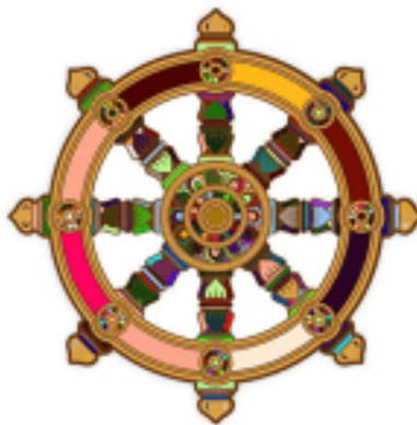
Roue du dharma