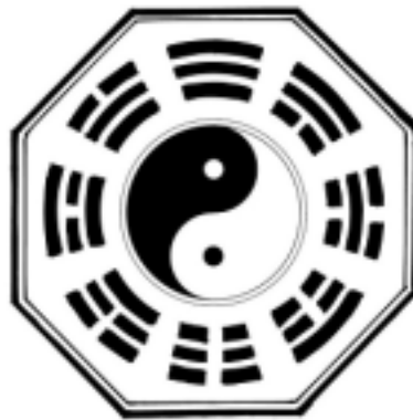
Yi Jing chinois