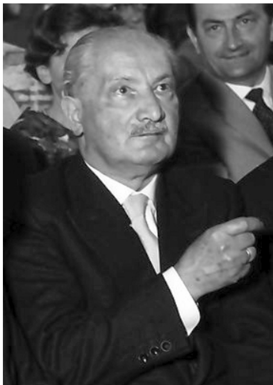
Martin Heidegger (1960).

Martin Heidegger , né en 1889 et mort en 1976, est un philosophe allemand. Il est considéré comme l'un des philosophes les plus influents du XX e siècle.