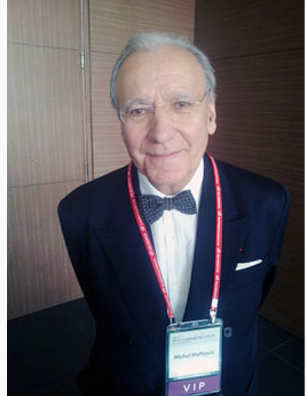
Michel Maffesoli en 2012.