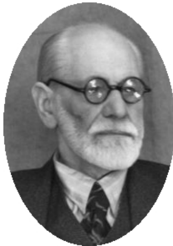
Sigmund Freud Psychanalyste

Voir le sites suivants : La psychanalyse , par René Degroseillers magapsy.com