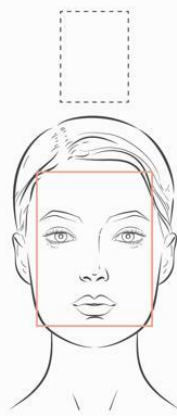
Rectangulaire ou allongée