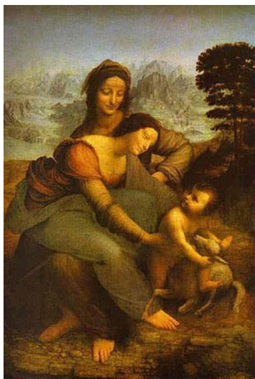
Léonard de Vinci Sainte-Anne, la Vierge et l'enfant

La peinture semble occuper ici une place privilégiée. Sa puissance esthétique tient à la charge fantasmatique de l'image. « Ce qui est d'abord demandé à un tableau, c'est de satisfaire un fantasme », constate un psychanalyste contemporain. Si l' image a la capacité d'éveiller les fantasmes du spectateur qui subit à travers elle la séduction et l' emprise des fantasmes de l' artiste , c'est parce qu'elle se montre d'un seul coup. Mais c'est surtout parce qu'« elle sollicite le psychisme par ses propres voies » ; elle est plus proche en effet des modes de pensée de l' inconscient , que l'on retrouve par exemple dans le rêve nocturne. Ce n'est sans doute pas un hasard si Freud choisit, pour inaugurer sa méthode, l'œuvre d'un peintre , Léonard de Vinci. Dans le tableau Sainte-Anne, la Vierge et l'enfant , Freud interprète l' image possible d'un vautour - qu'un de ses disciples a cru discerner dans les plis du manteau bleu de la Vierge - comme un symbole maternel , symbole qu'il relie à un fantasme de Léonard.