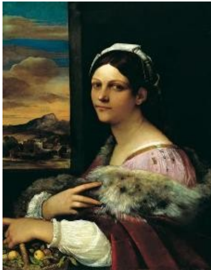
Sebastiano del Piombo Jeune Romaine dite Dorothée

sous le charme de la belle Vénitienne , à laquelle il trouve une ressemblance étrange avec la femme d'un restaurateur d'art présent au château. Intrigué par les récits de Magor, le restaurateur d'art – qui lui avoue comment, devant des tableaux qu'il appréciait particulièrement, il avait tenté d'y entrer – Simpson essaye à son tour, en grimpant sur une table, de s'envoler dans le tableau. Après l'échec de cette première tentative, le jeune étudiant se rend une nouvelle fois, en pleine nuit, dans la galerie où la toile est exposée, et, cette fois-ci, parvient à entrer sans effort dans le tableau .