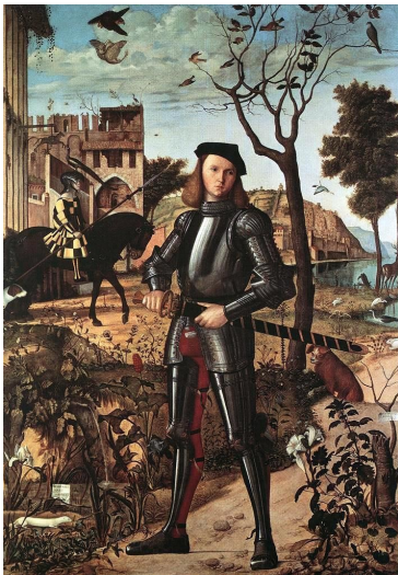
Vittore Carpaccio Jeune chevalier dans un paysage

Freud écrit à ce propos « le double était à l'origine une assurance contre la disparition du moi, un démenti énergique à la puissance de la mort ». Un psychanalyste contemporain, Jacques Clauvel, relate à ce propos le cas d'un de ses patients qui s'identifiait à un tableau célèbre du Carpaccio intitulé Jeune chevalier dans un paysage . C'est le portrait en pied d'un homme en armure , entouré d'oiseaux, d'arbres et de figures allégoriques. Ce jeune homme, en parlant du tableau à la place de lui-même, se protège de la profonde angoisse de mort qui l'habite « il a choisi (...) un double enfermé dans une armure de la tête aux pieds, comme pour élever un rempart plus solide contre l'effroi de l'anéantissement ».