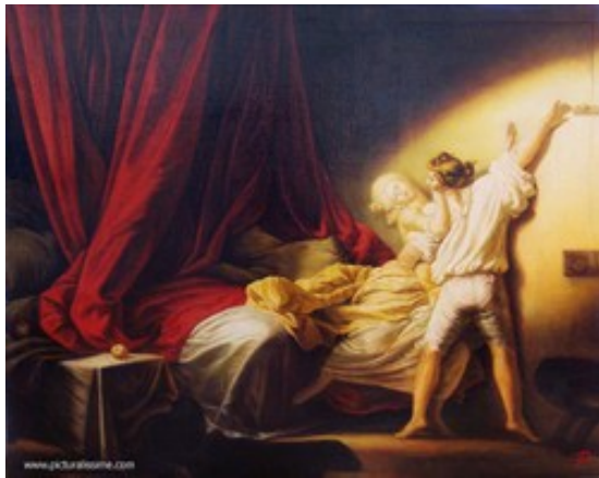
Fragonard Le Verrou

Ce n'est sans doute pas un hasard si cette remarque fait suite au commentaire passionnant que l'historien propose du tableau de Fragonard, Le Verrou , tableau qu'il qualifie de « tout à fait extraordinaire et fascinant » et dont il avoue qu'il fait partie de ces tableaux qui « l'appellent » et qui le touchent plus que d'autres.