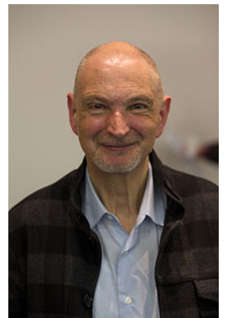
Serge Tisseron à Grenoble en 2013.

En 2014, dans Le Figaro , Serge Tisseron publie une tribune, sous le titre « Tant pis pour elles ! », pointant la "responsabilité" des actrices dont les photos intimes avaient été volées par un hacker, en pointant leur naïveté face à un « cloud » peu sécurisé, alors qu'elles sont par ailleurs tellement soucieuses de leur image. Cet article fut vivement critiqué par plusieurs observateurs 11, 12, 13 .