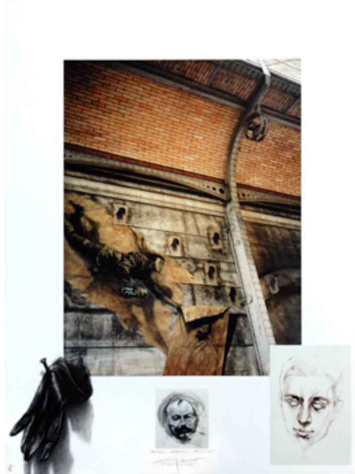
Estampe en hommage à Desnos par Ernest Pignon-Ernest

finalement évacué vers le camp de Theresienstadt en Tchécoslovaquie. C'est là qu'à bout de forces, atteint du typhus, il apprend la fin de la guerre et la défaite du nazisme. Il meurt le 8 juin 1945. Il est enterré au cimetière Montparnasse à Paris.