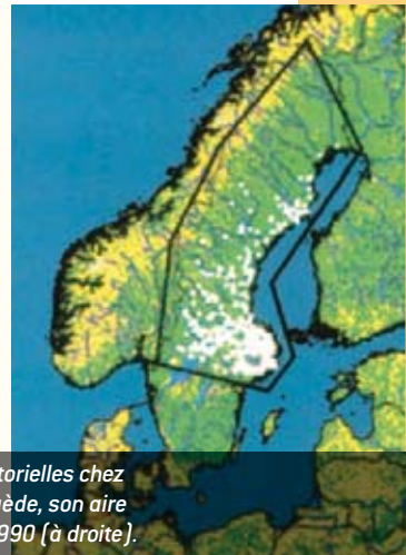
La tique Ixodes ricinus (à gauche), principale espèce vectrice de maladies vectorielles chez l'homme en Europe, devrait continuer à s'étendre au cours du XXI e siècle. En Suède, son aire de répartition (points blancs) a doublé entre les années 1980 (au centre) et 1990 (à droite).