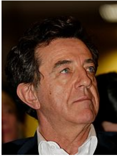
Yves Cochet, le 5 avril 2006 à un meeting de Dominique Voynet.

En 2001, il signe la mise en accusation de Jacques Chirac initiée par Arnaud Montebourg puis retire sa signature en expliquant qu'elle pourrait empêcher sa nomination comme ministre par le président de la République 8 .