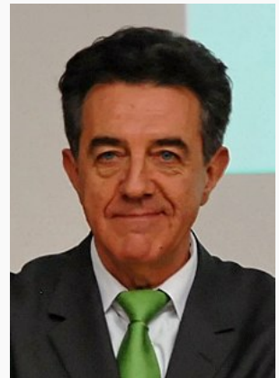
Yves Cochet en 2007.