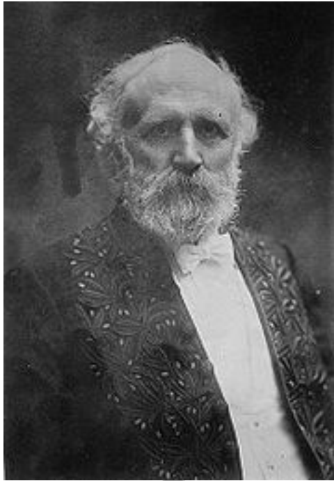
Théodule Ribot en 1914.

Théodule Ribot , né à Guingamp le 18 décembre 1839 et mort à Paris le 9 décembre 1916 , est un philosophe, généralement considéré comme le fondateur de la psychologie française. Il a créé et dirigé la Revue philosophique .